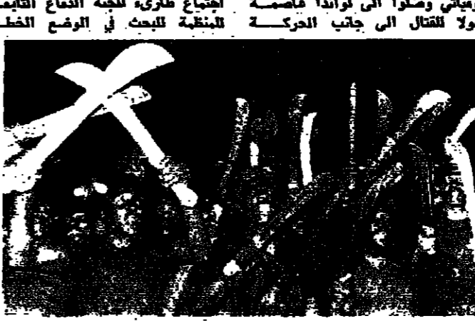
الميليشيا الثورية تحتفل بالاستقلال في منتصف ايل ١١ تشرين الثاني الجاري

هزيمة نيليس كاريترا الرئيس العسكري للحركة الشعبية لتحرير انغولا يتسلم اليمن القانونية كوزيسر للدفاع ويبدو الرئيس اغوستينو تيتو